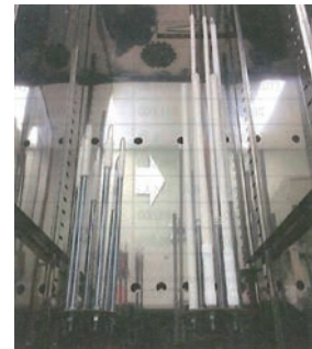
図2 現在開発・量産化検討を行っている柱状の分離膜ユニット 従来の5cmから、40cm以上の長尺化の開発を進めている。

原料の購入ルート、大学との共同研究体制、システム化を行うエンジニアリング会社との協業など、ナノセラミック分離膜の本格的市場立ち上げを目指して着々と体制を構築しています。