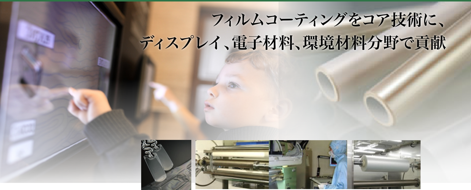
左: 機能転写フィルムを成型樹脂に転写した例、右3点: 得意とするロール・ツー・ロールの成膜プロセス