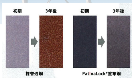
図1 Pat!naLock®を用いた塗装鋼と通常の塗装鋼の比較

同じ金属酸化物でも、錆のように基材を腐食し構造の寿命を短くするものもあれば、アルミニウムの酸化被膜のように緻密な膜を作り基材を安定に維持するものもあります。株式会社京都マテリアルズは、確かな材料科学の基礎知見に基づき、金属酸化物の構造を突き詰めることで、いわば「よいさび」を育成して鉄塔や橋梁などの社会インフラ構造物を長期にわたって保護する、反応性塗料「Pat!naLock®」を研究開発し、商社(長瀬産業(株))と連携して販売しています。