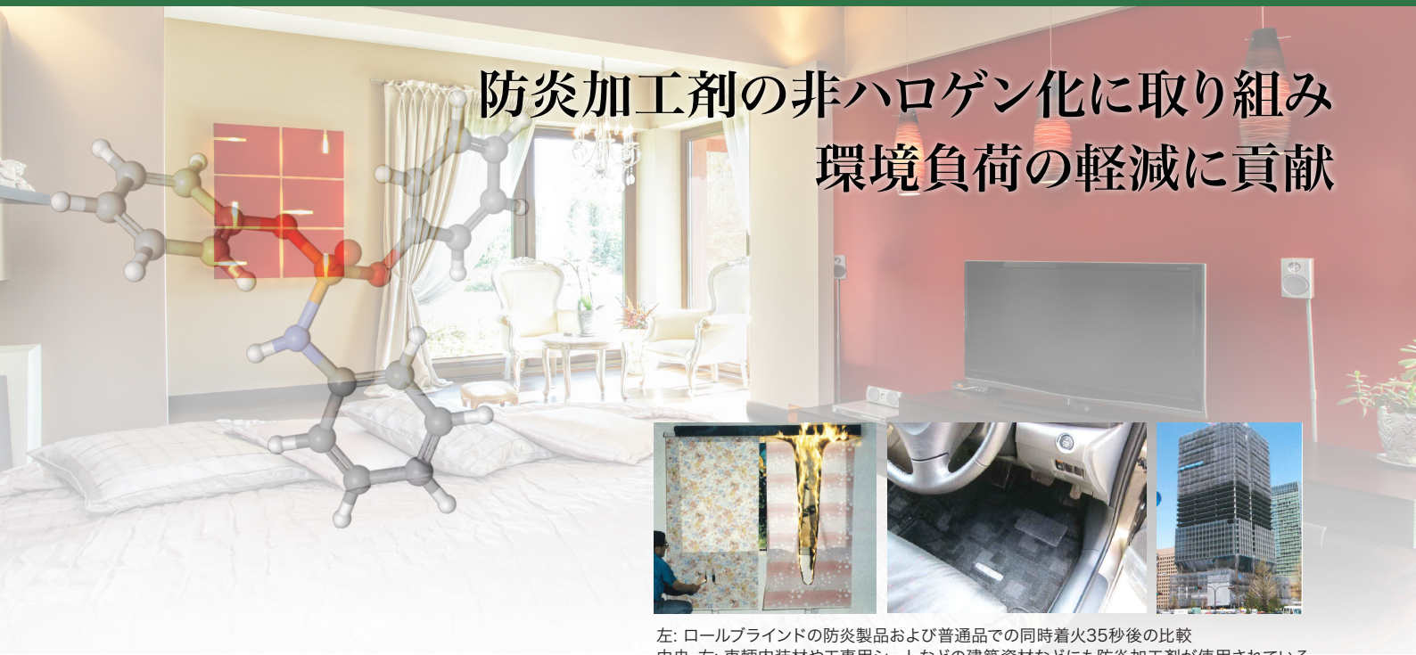
左: ロールブラインドの防炎製品および普通品での同時着火35秒後の比較 中央、右: 車輦内装材や工事用シートなどの建築資材などにも防炎加工剤が使用されている