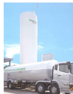
宇治田原工場における液化水素貯蔵タンクおよび水素ガス製造設備

宇治田原工場では、大量の水素ガス・エネルギーを消費するガラス加工において、地球環境の保護を目的に、水素貯蔵設備や廃酸・廃水処理設備を工夫しています。以前は、気体水素での調達で日に3回運搬していましたが、液化水素に変えることで3週間に一回程度まで抑え、運搬にかかるコストやエネルギーの削減を図ってきました。今後も、京都グリーンケミカル・ネットワークを活用して、他業種と連携していくことを検討しています。