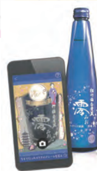
図1 宝酒造株式会社の商品プロモーションの事例 ラベル印刷にとどまらず、商品のプロモーションのため、ユーザー参加型のスマートフォンアプリを提案・開発している。